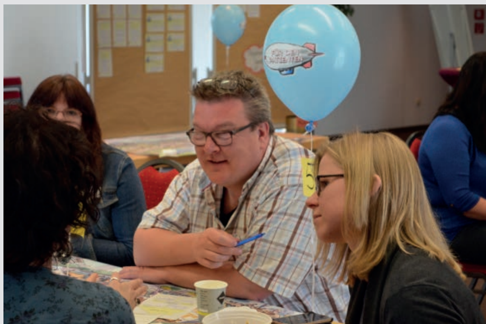
Oben: Das gemeinsame Spielbrett (inkl. Karten) als wesentliches Kommunikationsmedium. Unten: Mitarbeiter diskutierten spielerisch Zukunft.