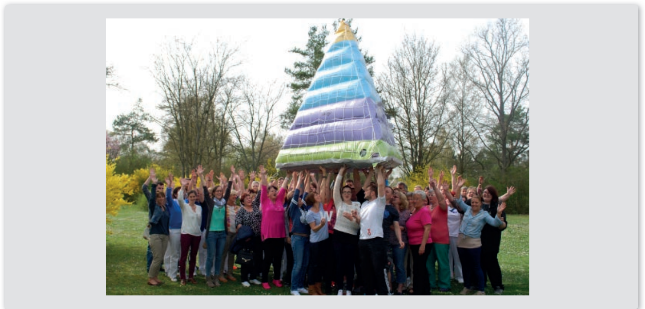
Oben: Unser roter Faden. Unten: Unsere neue Strategiepyramide – WIR packens an!